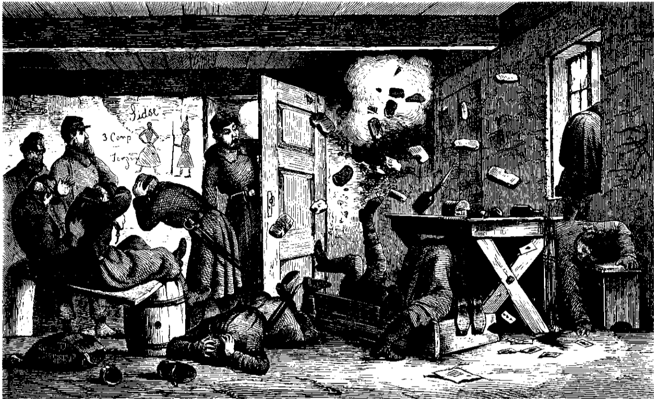
En Scene fra Strandvægten paa Als, tegnet af Lieutenant V. D.

ser ere aldeles uskiftede til at danne Grundlaget ved Underhand- lingerne paa den Conference, som efter mange Fataliteter omsider har holdt sit første Møde den 25de April. „Dette sidste Træk paa det politiske Skafbræt,“ siger „The Examiner“, fuldstændig- gjør det troloste Overfalts Historie. Før end Østerrig og Preussen gik over Sideren, ja endog længe efter at dette Grandsjævel var overstrebet af deres Armeer, forskikrede disse Stormagter, at de kun vilde tvinge Danmark til at opfølge en europæisk Statsacts Bestemmelser. Diplomaterne toge deres Brillen paa, betragtede den i officielle Depecher og Noter afgivne Forsikkring fra alle Sider og udtalte med sædvanlig Skarp- sindighed deres Tilfredshed dermed, uagtet der alt dengang