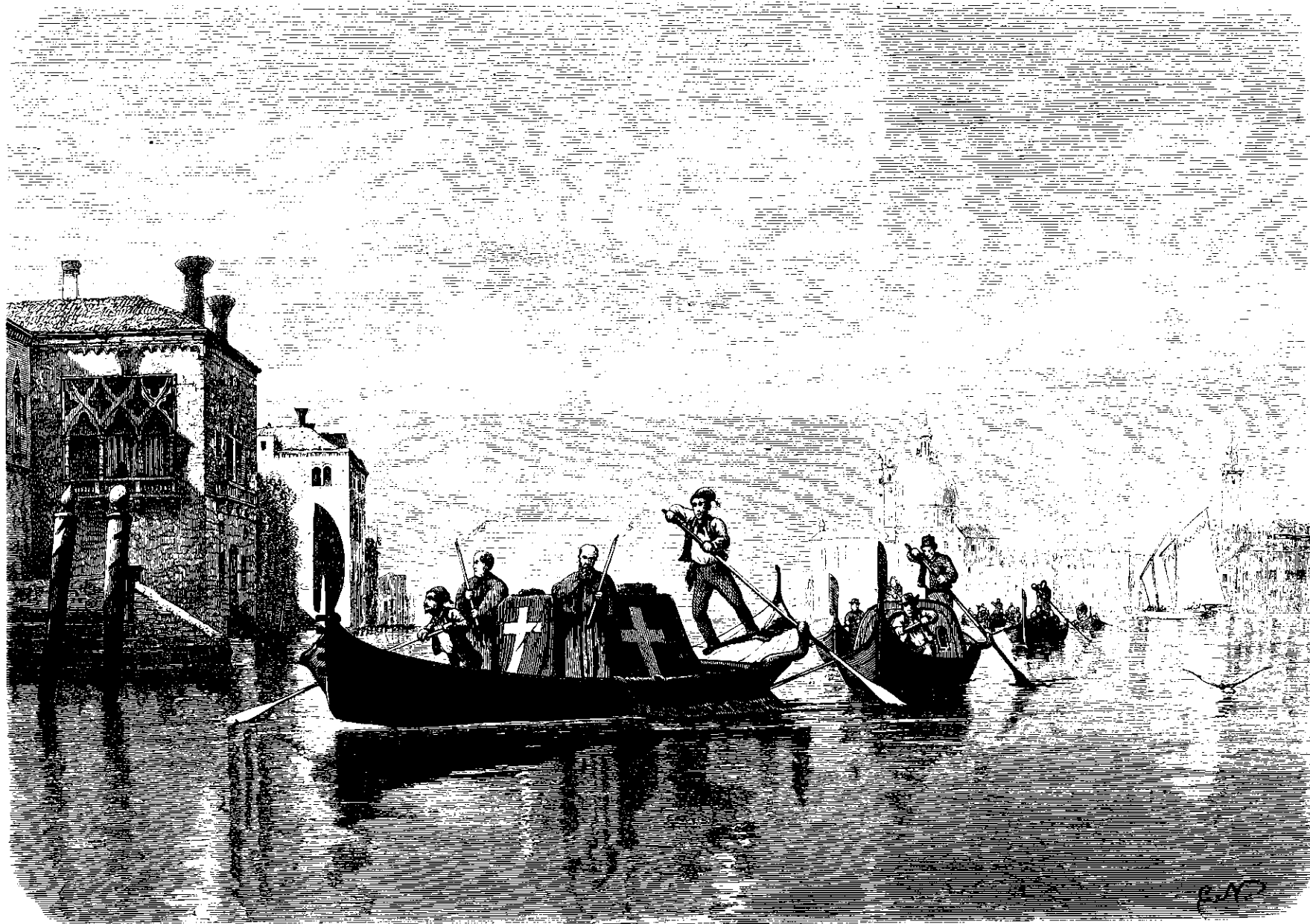
En Ligbegængelse i Venedig, tegnet af C. Neumann.

undere, at Tilhøveren sølte sig henreven deraf. Men da han tilfældigvis lafede et Blik ud i Havesalen, blev han opmærksom paa Helmas lidende Udtryk og den fynlige Anstregelse det kostede hende, at tage Deel i den almindelige Underhold-