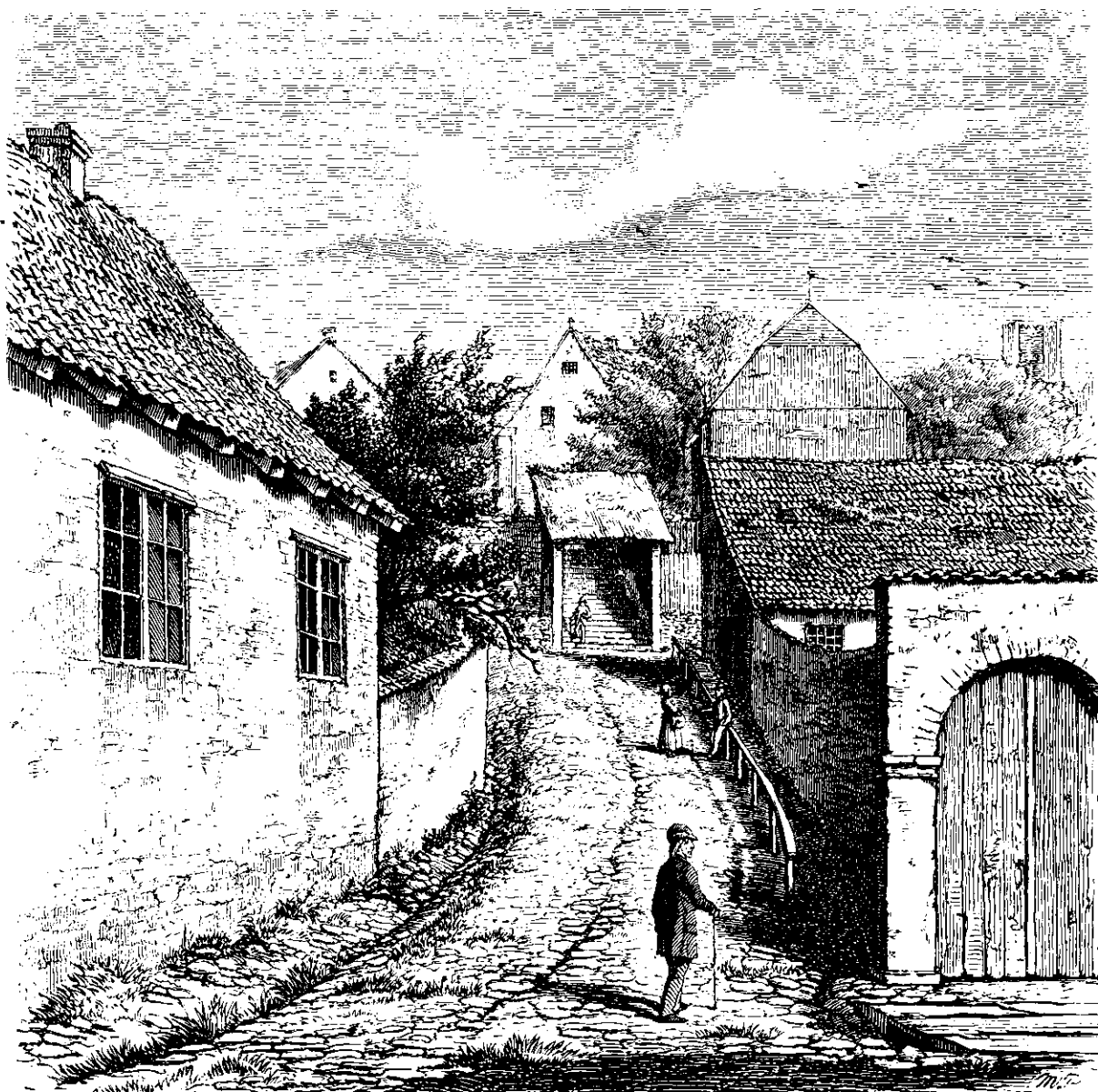
En Gade i Viborg. Tegnet af Magnus Peterfen.

man først passere, og hvis man undervejs vil tage alt det med, som med Nette kan sængsle Diet, kan man magelig faae en stiv Dagsvandring ud af det, men — man har da ogsaa gjort en god, en rigtig god, Dagsvandring.