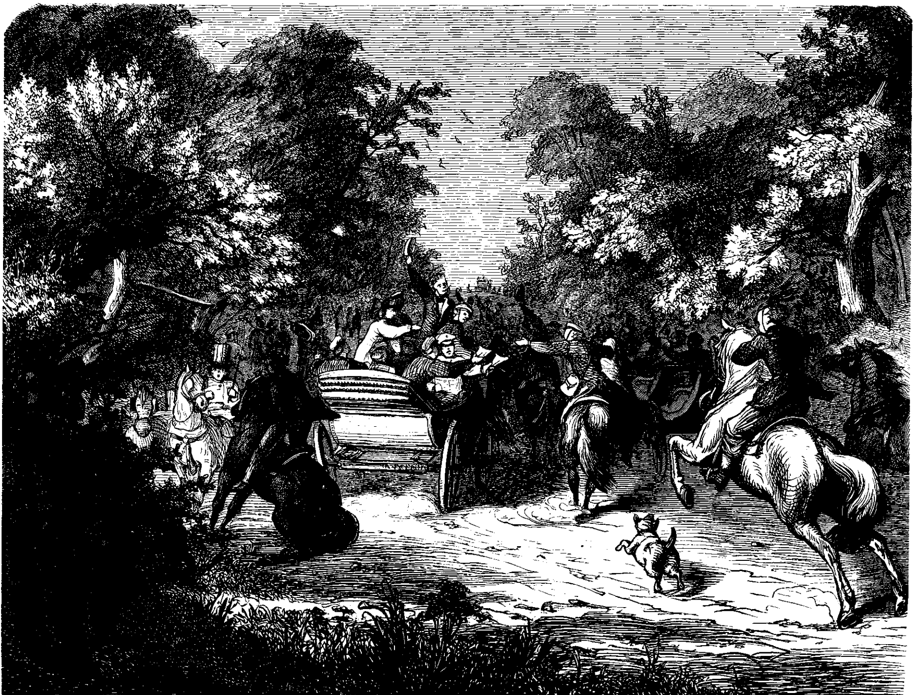
Paa Veien mellem Fredericksborg og Fredensborg den 15de Juni 1862. (Stikke af Ludvig Schou.)