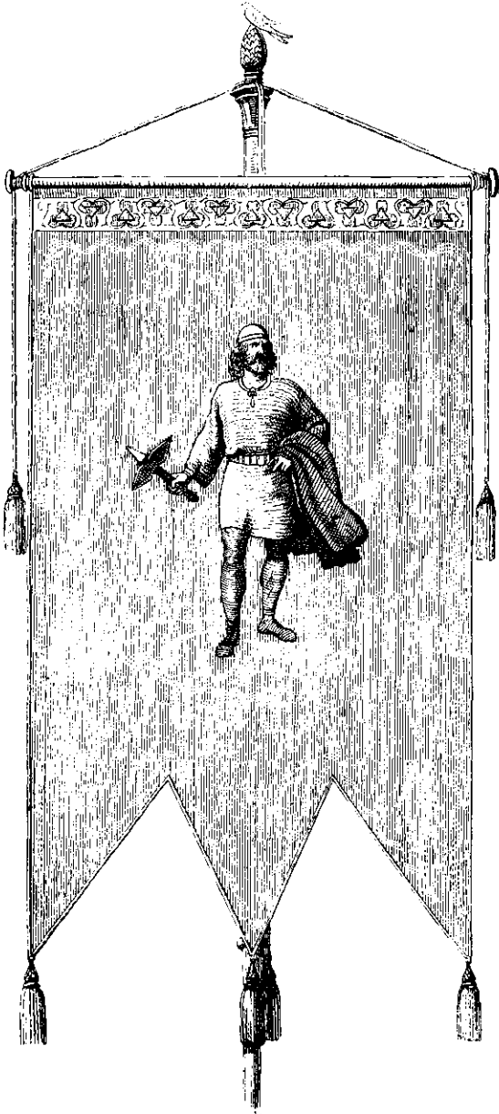
De norske Studenters fanen.

biste Sag, da var det denne Stund, da Danmarks Kvinder gennem sine Udsendinge vare forsamlede og overrakte Nordens Guder, som Mærker, til den forenede nordiske Ungdom, der her stoltedes om et skønnere Læresæde end noget Universitetslatheder med en docerende Professor. For hver af Fanerne blev der udtalt en hjertelig Tak, med det gjentagne Løfte, aldrig at svigte Banneret, selv naar det venter til Kamp for de danske Kvinders Land. De forskjellige Sangforeninger stemmede derefter i, den ene efter den anden; men Upsalensernes mesterlige "Fansang" af Wennerberg: Stå stark, du ljusets riddervakt! - forbrunkede dog Alt, ja maaskee enhver Sang, der kom til at lyde under hele Mødet.