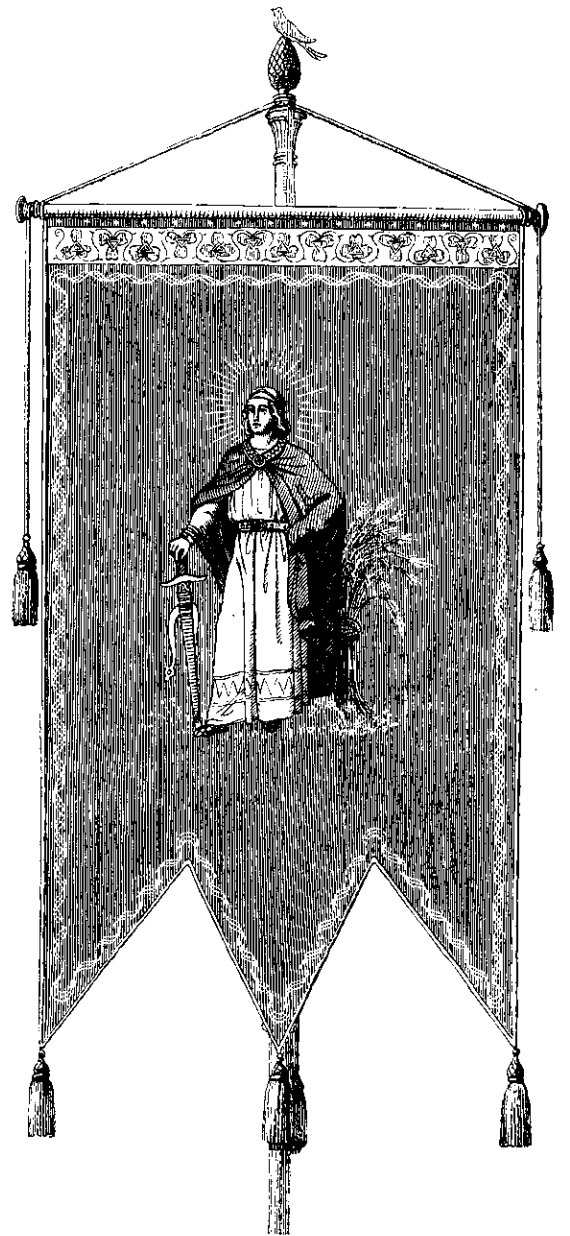
De Lundenske Studenters Fane.

fremmest Billeber af hvert godt og ærligt Luffe for Nordens Sag, som de danske Kvinder havde indstiftet under de mange tusinde smaa Sting paa den røde og blaa Silkebund. Med en uendelig Jubel og rungende Hurraer blev hver Fane hilset, og flere have siden pttret, at, var der Noget, som ved dette Møde maatte henrive og beaande dem ret for den nor-