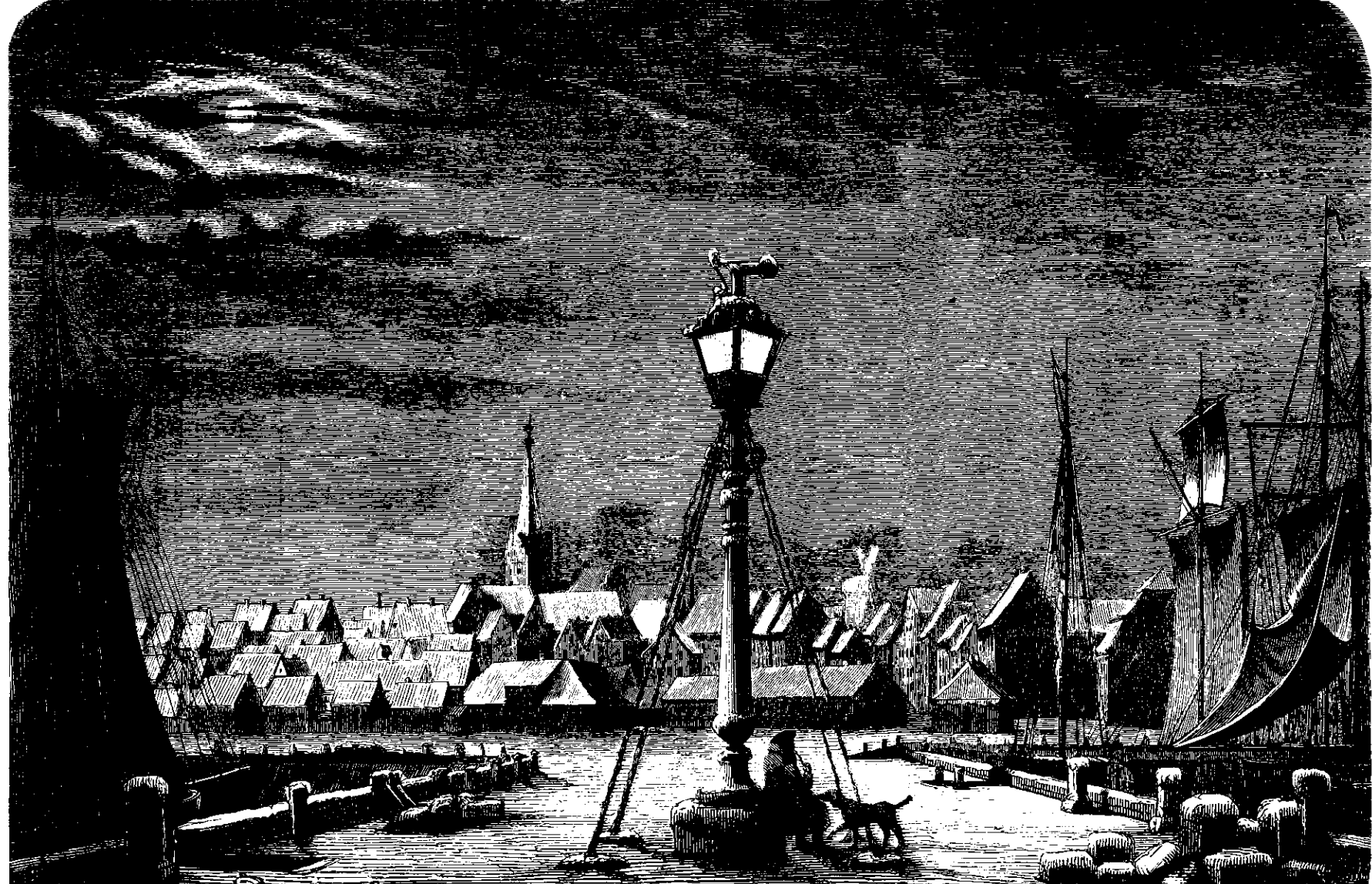
Parti af Rudehøbing. (Efter en Skizze af Christian Hetsch.)