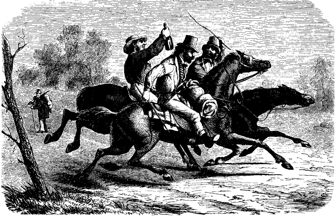
Afsted til Port Curtis!

Næste Dag lykkedes det mig ved gode Benneres Hjælp at faae mit Telt op, der paa engang tjente til Bountil, Pakhuus, Sovegemal osv.; med de sædvanlige Hjælpekilder i Minerne, gamle Fouslager og Barkstykker, havde jeg snart Disten færdig og manglede nu kun Kunderne. De kom ogsaa. Folk maae leve, hvor de saa end opholde sig; da mit Udsalg nærmest kunde kaldes en Spøkhøkerbountil og mest indeholdt Fødevarer, folgte jeg ogsaa mine Bæser godt. Arbejderne syntes alle at være ved godt Mod, og da Jagen endnu var gaaet dybt nok til at kunne dømmes om Rigdomigheden, nærmede de som sædvanligt de mest overdrevne Forhaabninger. Efter endt Dagsværk leirede de sig ved Baal, der altid holdes vedlige udenfor hvert Telt, for at nyde Aftensmad, og gjorde derpaa Besøg omkring til Naboerne for at høre, om Noget af Velydenhed var fundet. Det Hele tog sig malerisk ud og Virkningen blev orchiet ved en Skovbrand, der netop udbrød paa Høiene hin-