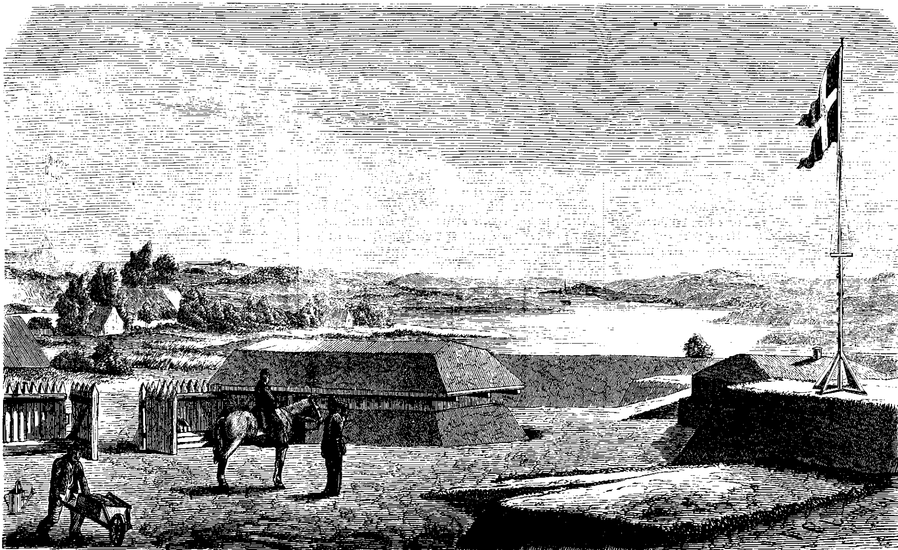
En Skanse ved Midsunde.

entelte paa Bantettet udstillede Posler iagttage Fjendens Bevægelser. Det fjendtlige Artilleri rykker nærmere, Skydningen fortsættes fra den nye Stilling for at gjøre Forsvarerne mobile og derved forberede Infanteriangrebet. Infanteriet rykker efter, nærmer sig Standsen, pludselig ophører al Skydning, Infanteriet rykker frem til Storm. I dette Dieblit bringes Standsens Kanoner op, Infanteriet besætter Bantettet, de mobile Reserver, der findes bag og i Nærheden af Standsen, rykke frem til Udsætning, og den stormende Fjende, taget i Front og i Flanke, viger tilbage. Det første Angreb er tilbageslaaet, dog ei uden Tab for Forsvaret. Angrebet gjentages og afslaaes. For 3die Gang gjentages det, de forreste fjendtlige Geledder styrte ned i Graven, bestige den indre Straaning og ankomme paa Brystværnets Krone. Forsvarerne bestige Brystværnet og modtage de Stormende med sælbt Bajonnet,