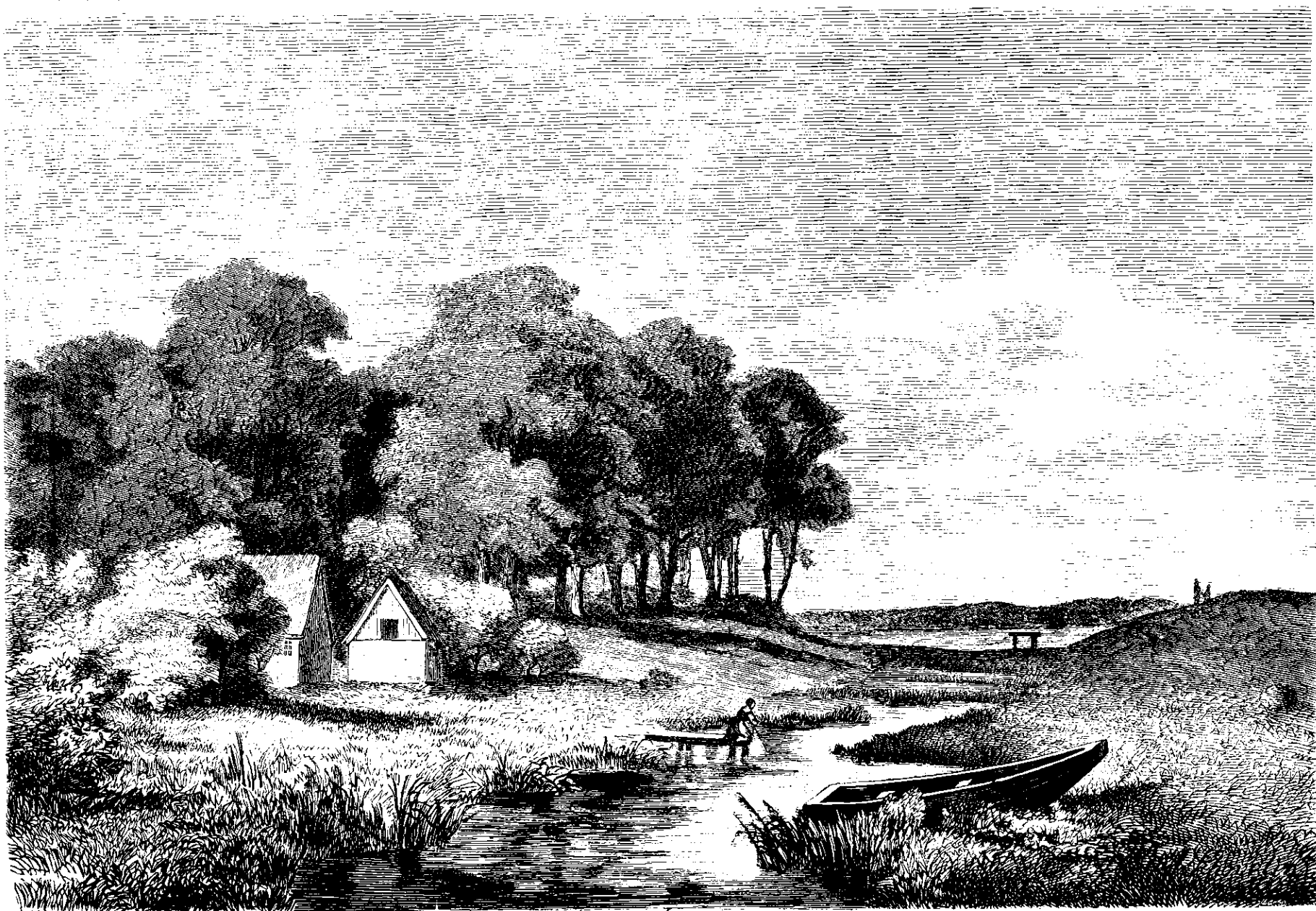
Mollegaens Udspring af Fuursøen, tegnet af Axel Schovelin.