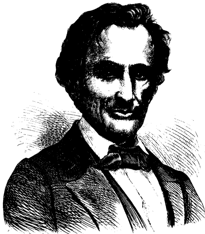
Præsident Abraham Lincoln

De nordamerikanske Fr-staters fremtidige Præsident Abraham Lincoln er født den 12te Februar 1809 i Hacesin (Illinois), hvor hans Familie nyder megen Anseelse. Da han er ufornuende, maatte han i sin Ungdom ernære sig som Pælehugger; senere studerede han Jura og nebfatte sig som Advocat i Springfield, hvor han boer endnu. I Blad-Hanf-Marktrigen i Foraaret 1832 tilbød Lincoln sin Tjeneste og blev udnævnt til Capitain for et af Frivillige bestaaende Compagni, i Spidsen for hvilket han udmærkede sig. Som Medlem af Illinois' lovgivende Foriamling sluttede han sig til Whiggerne. I Aaret 1846 blev han Medlem af den trediede Congress, og i Nationalconventet, som i Juni 1852 valgte General Scott til Præsident, repræsenterede han Illinois i den vigtigste Centralcomitee. Fra Aaret 1856 deeltog Lincoln virksomt i de politiske Kampe og var et meget ivrigt Medlem af det republikanske Parti; denne Omstændighed har han fornemmeligen at talke for, at dette Parti har opstillet ham som sin Candidat til Præsidentposten, og hans Fortid kan i ethvert Tilfælde ikke oplyse om og hvorvidt de store, til hans Valg knyttede Forventninger ville blive opfyldte.