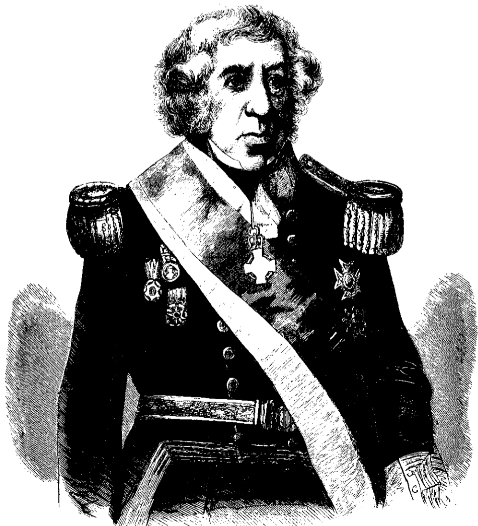
Lord Thomas Cochrane, Greve af Dundonald.