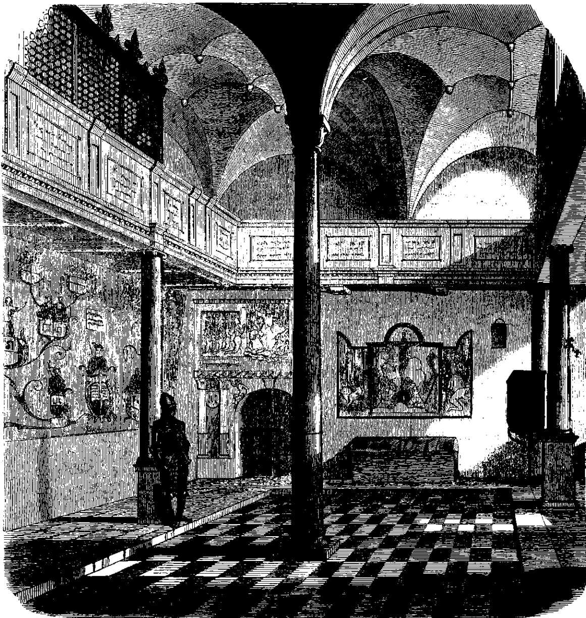
Det Indre af Sønderborg Slotskierke, efter en Skitse af W. Faurholdt.

Paa Grund af de store Omkostninger, der vilde være