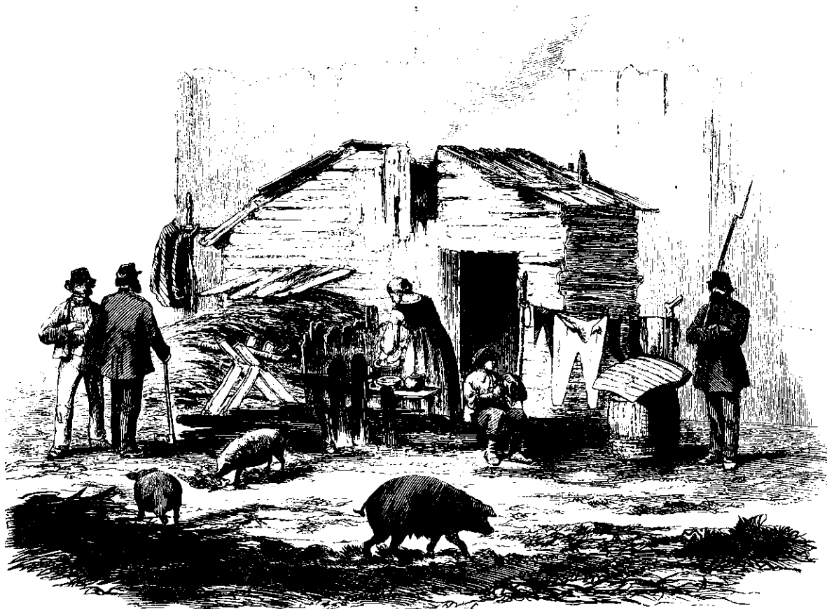
Skizze fra Leiren.

baade indvendig og udvendig beklædt med Kobber og Bly. Samtidig med Slottet, og i nogle faa Alens Afstand fra dets nordre Endefacade, er opført den saakaldte Vagtstue, fra hvis Port en bred Vindebro tidligere førte over den nordre Grav. Denne, og den befærdte grønne Bro, der mod Syd fører over til Haven, dannede de to eneste Udgange til Slotsøen. Hovedindførselen var oprindelig hvor den er endnu, ved Nørrebrogade, og derfra gik Veien over Vindebroen, gennem Vagtstuens Port, tilvestre ind i Slotsgaarden, der optog det større østlige Parti af Slotsøen, medens derimod det mindre, foran Slottets vestre Facade, var indrettet til et Blomsterparti. Hovedindgangen til Slottet var mod Gaarden i det midterste østre Taarn, til hvis Stueetage en dobbelt Steentrappe førte op, der imidlertid senere, under Christian VI, er bleven borttaget; Indgangen er nu tæt sønden for det nordre Taarn. Ved Slottets søndre Ende kom man, som sagt, over den grønne Bro ind i den smukke og store Have, der strakte sig mod Nord fra Gøthersgade til Sølv-