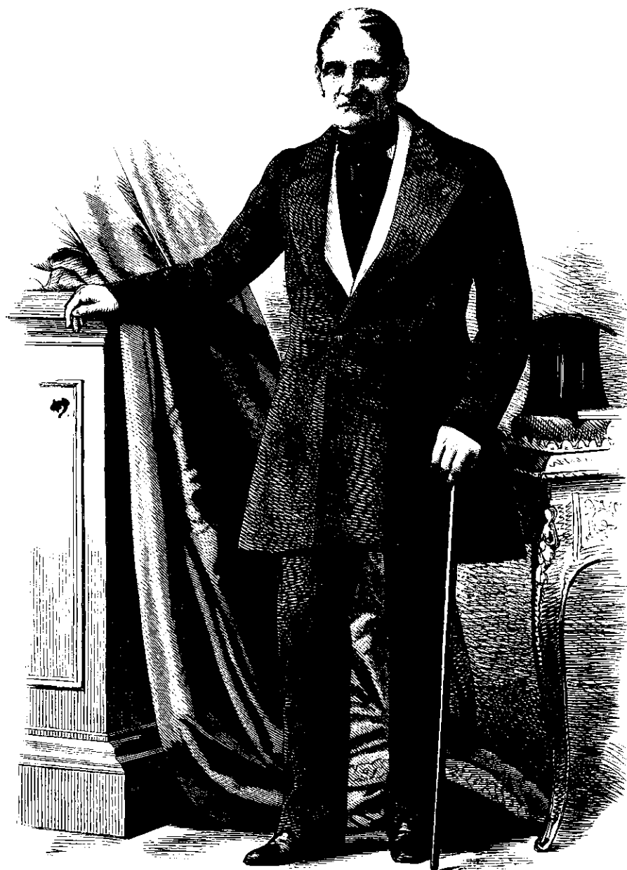
Jerôme Napoleon Bonaparte.

En Krone blev Jerômes Belønning for de Tjenester, han i Løbet af dette Felttog havde ydet. Hannover, Hertugdømmet Brunsvig, Churfyrstendømmet Hessen-Cassel, Fyrstendømmerne Halberstadt, Magdeburg, Minden, Verden og