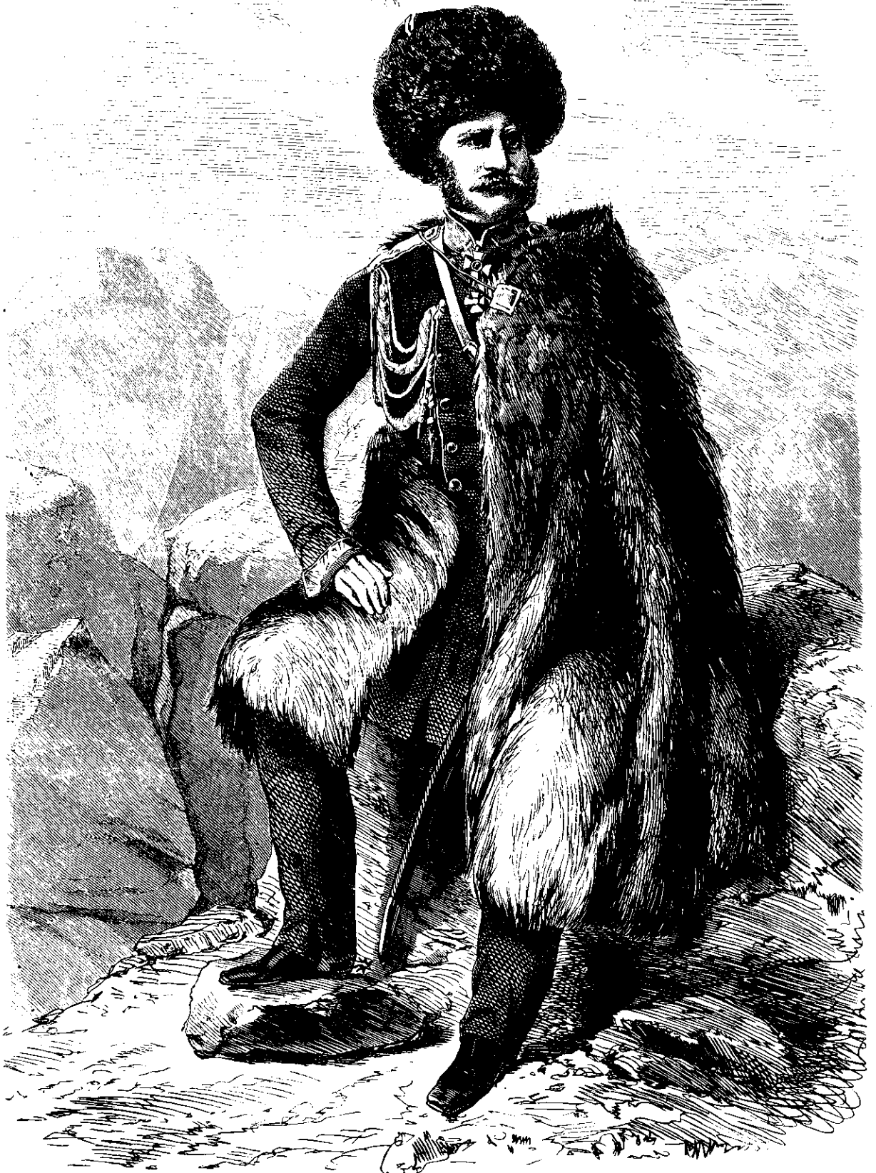
Fyrst Variatinski, Overbefalende over den russiske Hær i Kaukasus.

Schamyl formaaede ikke at drage nogen Nytte af Vestmagternes Krig mod Rusland, da han ikke kunde forlade sine Bjerge; efter Fredens Afslutning slog hans Time. Rusjerne havde nu kun en Fjende at bekjempe og Variatinski fik i 1856 Overbefalingen med det Øverv, at undervinge Kaukasus. Fra denne Tid af faldt det ene knusende Slag efter det andet paa de uhykkelige Bjerghøiers Hoved. Fyrsten gik angrebsvis frem paa venstre Flanke og nsejedes med at holde Bjerghøierne paa høire Flanke i Tømme ved at anlægge nye Fæstninger.